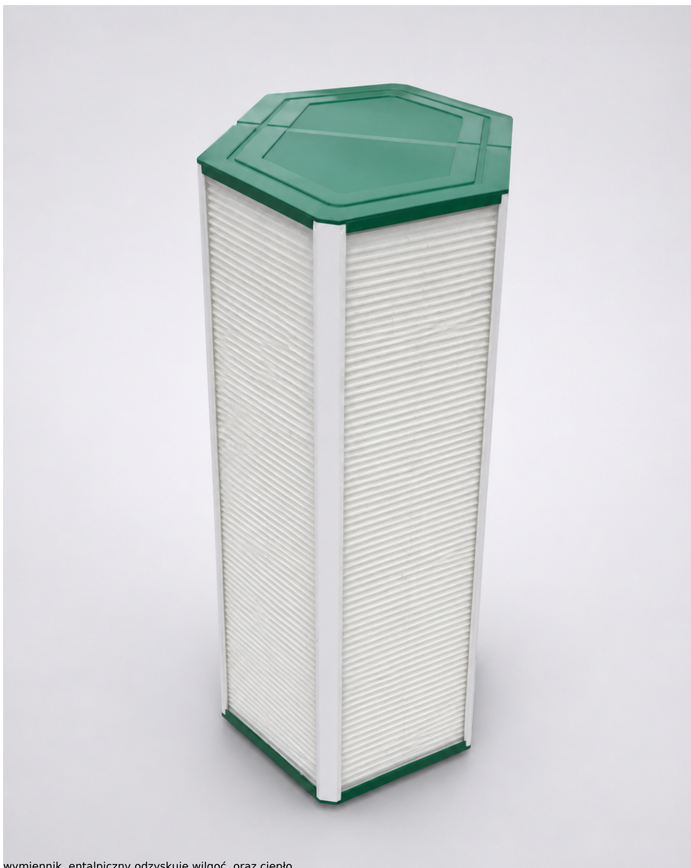
wymiennik entalpiczny odzyskuje wilgoć, oraz ciepło